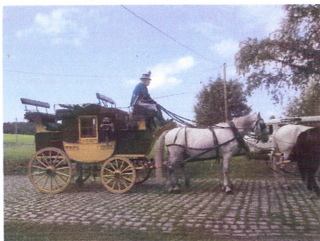
Das war unsere Kutsche