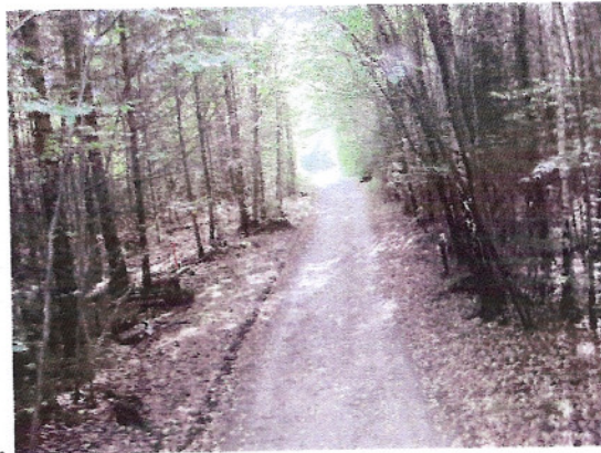
Wunderschön durch den Wald...