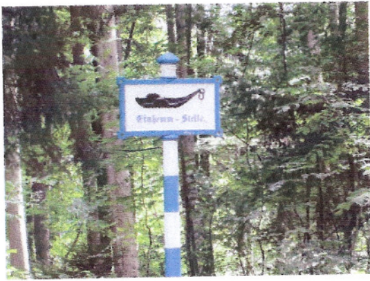
Ein altes Verkehrsschild, von dem es nur noch 7 Stück in Deutschland gibt!