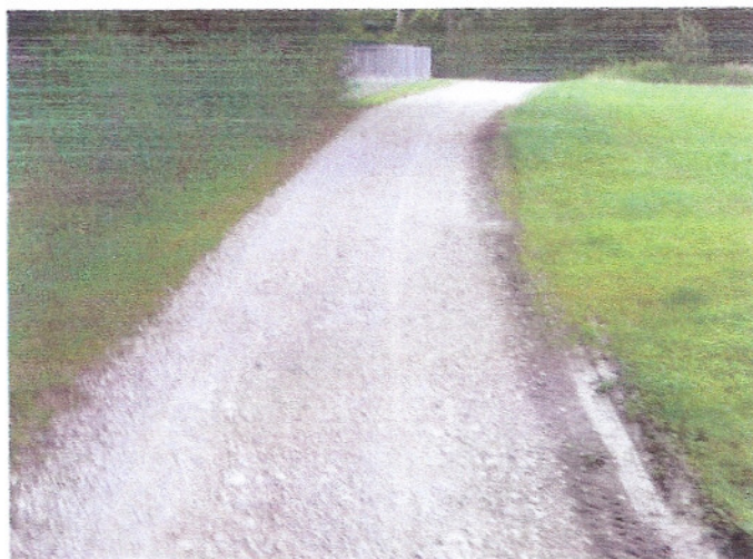
Ein toller Weg....