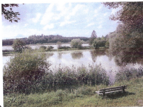
... bis zum idyllischen See