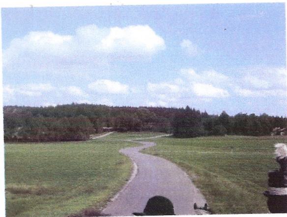
.... und freie Flur